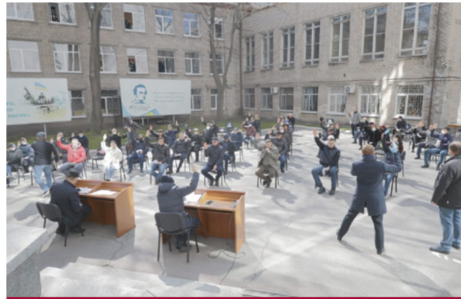
Дніпровська міська рада засідає у дворі через епідемію.

Проте є важливим перший досвід Дніпровської міської ради, яка 25 березня 2020 року спочатку провела звичайне засідання, де затвердила порядок денний і прийняла рішення №2/55 від 25 березня 2020 року «Про внесення змін до Регламенту Дніпровської міської ради VII скликання». Цим рішенням було передбачено проведення дистанційних засідань. Вказане рішення доступне на сайті міської ради. Потім міська рада після перерви провела дистанційне засідання в режимі відеоконференції. Відеозапис на YouTube доступний за посиланням https://youtu.be/u2xP6LHilLw .